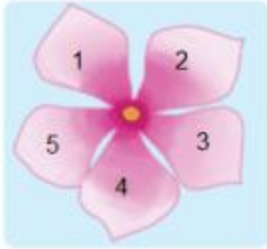
5 cánh hoa