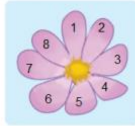
7 cánh hoa