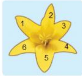
6 cánh hoa