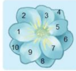
10 cánh hoa