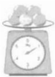
Túi cam cân nặng 1kg