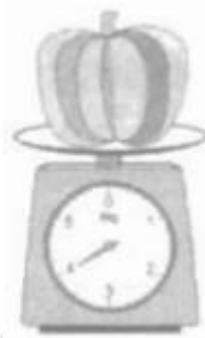
Quả bí ngô cân nặng....kg