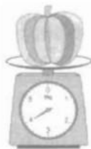
Quả bí ngô cân nặng 4kg