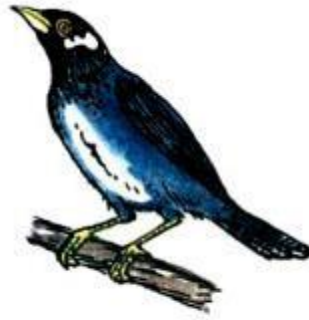
Chim ... biết nói tiếng người.