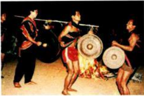
Lễ hội cồng ch... ở Tây Nguyên.