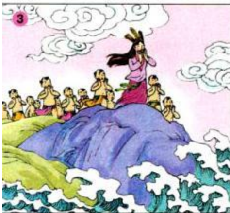
Âu Cơ và các con làm gì ?