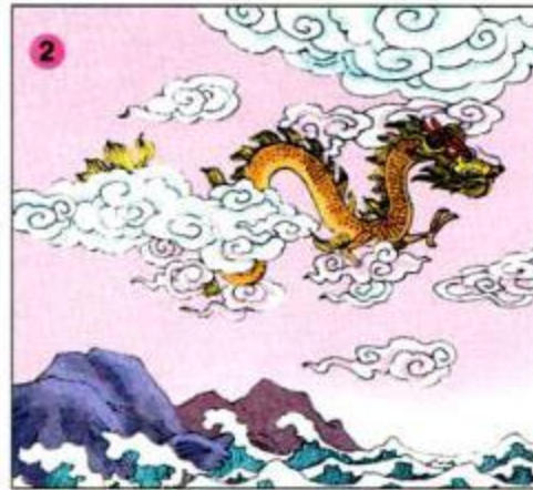
Lạc Long Quân hoá rồng bay đi đâu ?