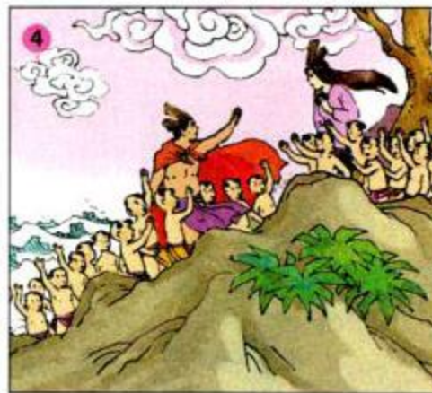
Cuộc chia tay diễn ra thế nào ?

Tranh 1: Gia đình Lạc Long Quân sống hạnh phúc, đầm ấm bên nhau.