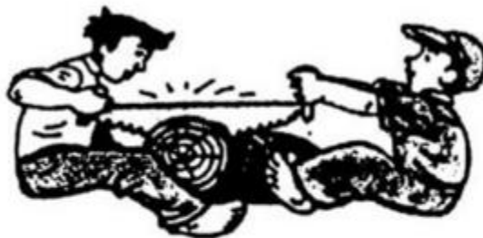
cưa xoèn xoẹt