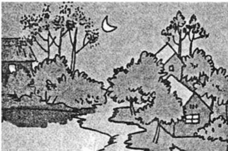
Cảnh đêm khuya kh.....