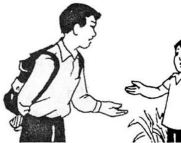
Hà gặp một người lạ h.....

Giải câu 3 trang 70 vở bài tập Tiếng Việt lớp 1