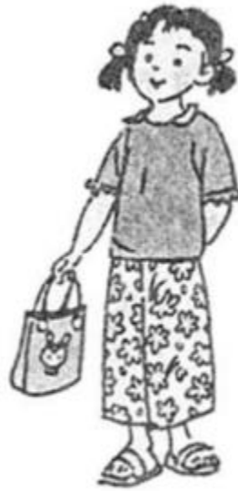
Bé ...ách túi.