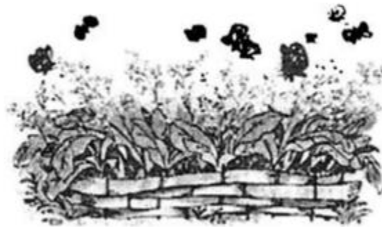
...ườn rau xanh tốt.