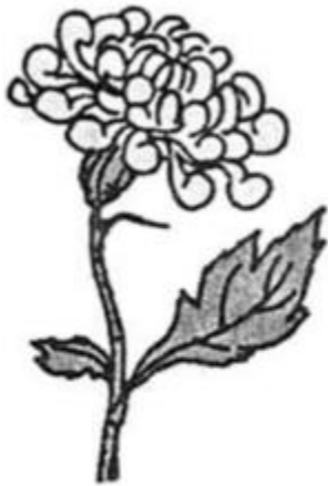
Hoa cúc ...àng.