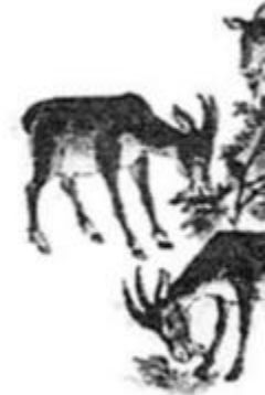
Đàn ...ê à