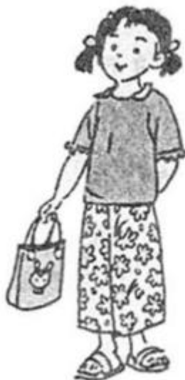
Bé xách túi.