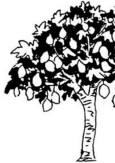
Cây ...ai qu