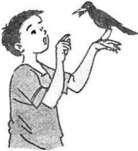
...áo tập nói.