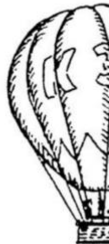
Khinh cầu đan

Giải câu 4 trang 63 vở bài tập Tiếng Việt lớp 1