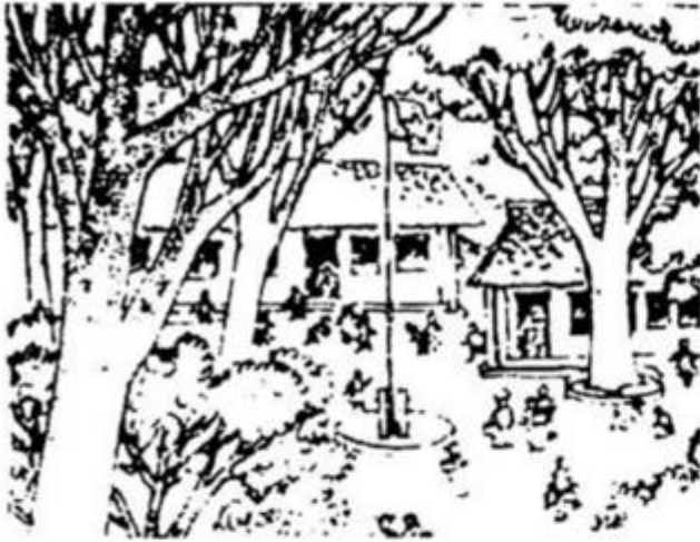
Trường của em bé Nằm lặng giữa rừng cây