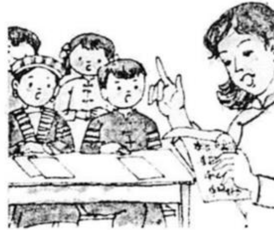
Cô giáo em trẻ trẻ Dạy em hát rất hay