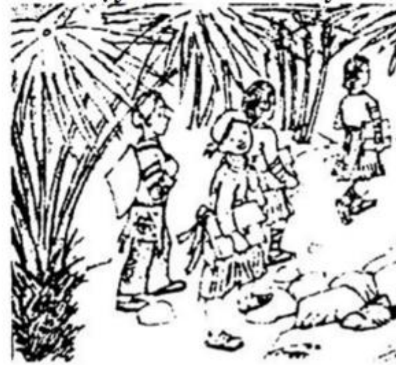
Cọ xòe ô che nắng