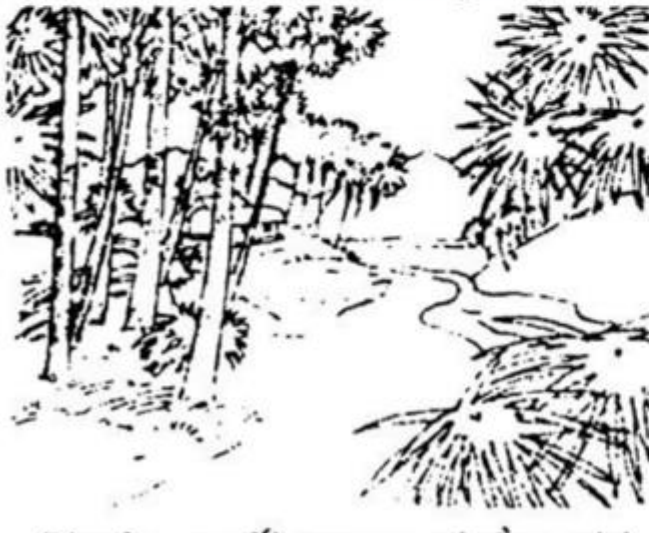
Nước suối trong thẳm thì