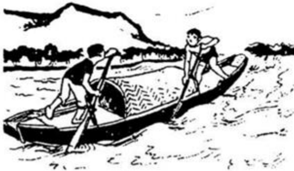
con thuyền vượt ghềnh thác