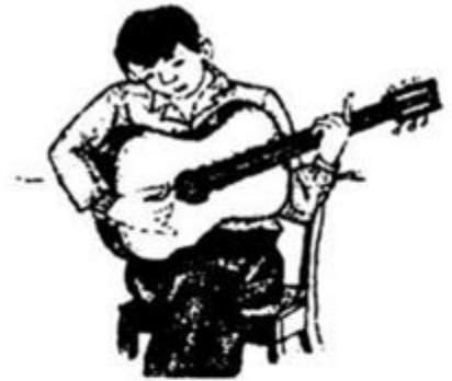
chơi đàn ghi ta