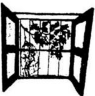
Cửa sổ mở toang.