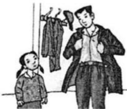
Bố mặc áo khoác.