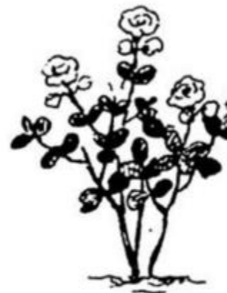
Thoang thoang nhà mà lại thơn.....