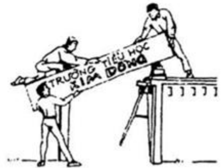
gắn biển treo tường

►► CLICK NGAY vào TẢI VỀ dưới đây để download giải VBT Tiếng Việt 1 Bài: Cây bàng trang 56, 57, 58 ngắn gọn, hay nhất file pdf hoàn toàn miễn phí.