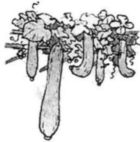
giàn mướp bên bờ

Giải câu 3 trang 53 vở bài tập Tiếng Việt lớp 1