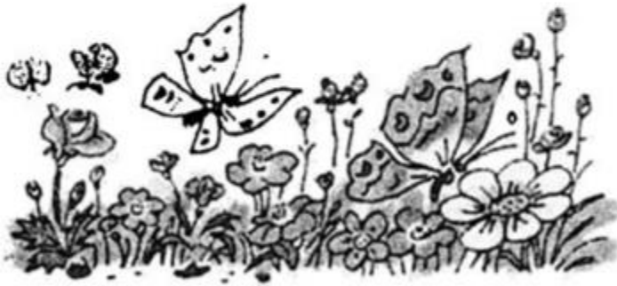
Bướm bay dập dờn