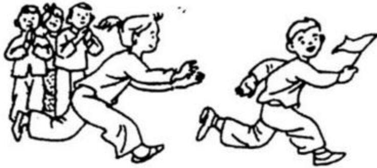
trò chơi chớp cờ