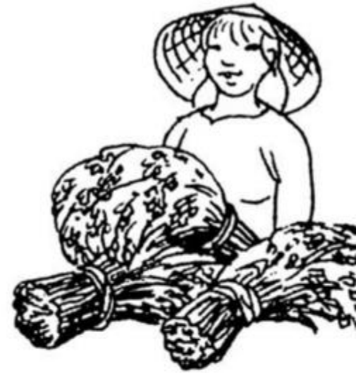
những lượm lúa vàng