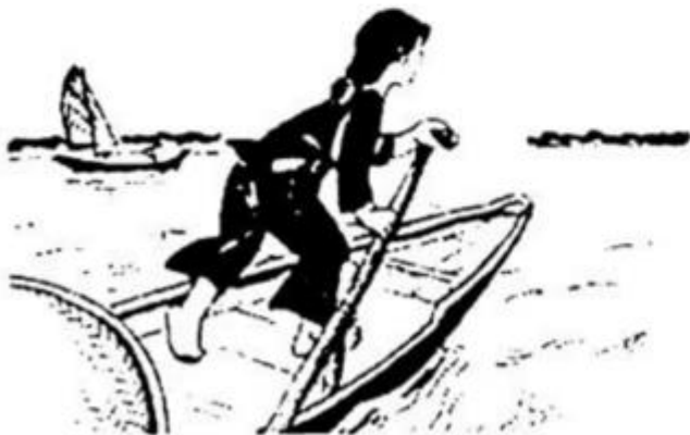
Bơi thuyền ngược dòng.