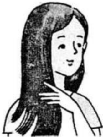
Mái tóc rất mượt.