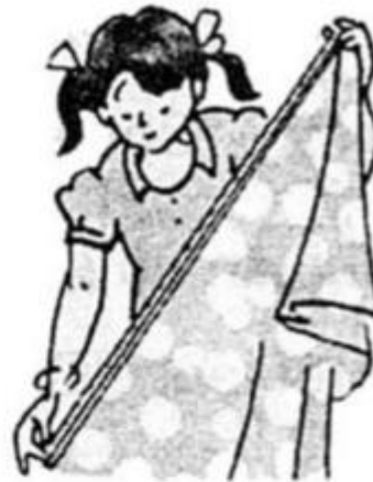
Dùng thước đo