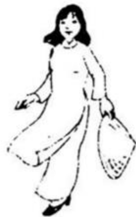
Dáng điệu thướt

Giải câu 3 trang 50 vở bài tập Tiếng Việt lớp 1