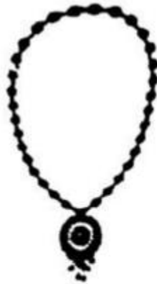
sợi dây chuyển