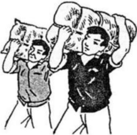
công nhân khuân ưác