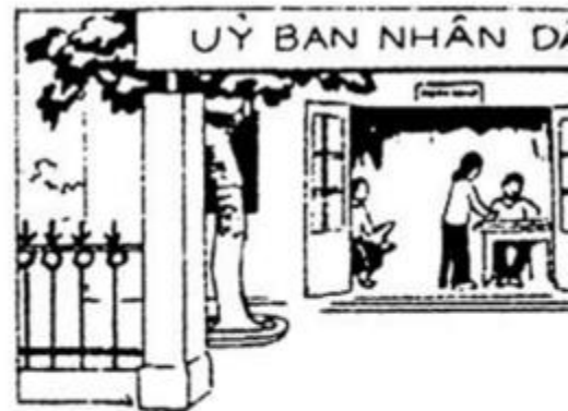
căn phòng ủy ban