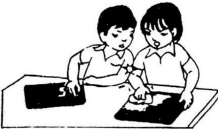
huých vai bạn