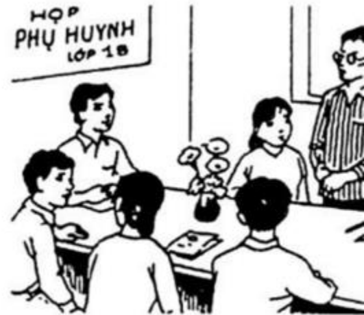
họp phụ huyn