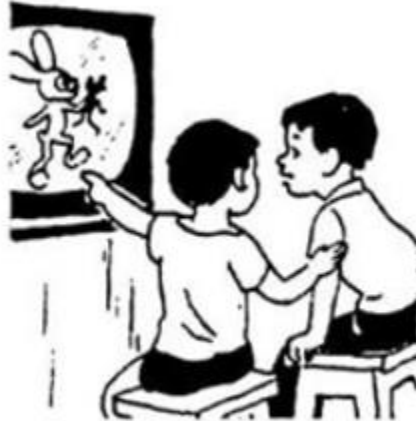
xem ti vi