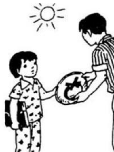
vâng lời người t

Hoạt động 3 trang 54 vở bài tập Tiếng Việt lớp 1: Viết