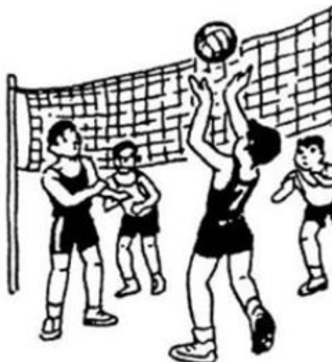
nâng trái bóng