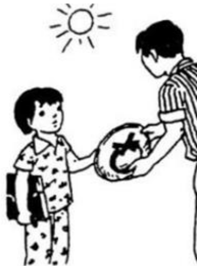
v..... lời người t