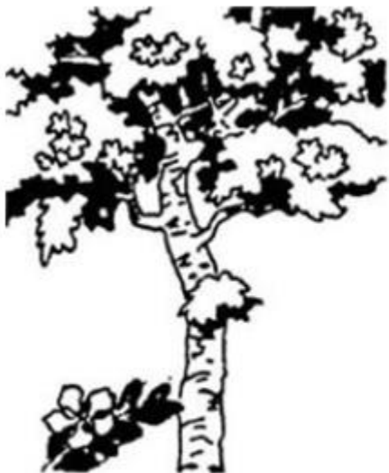
cây bằng lăng