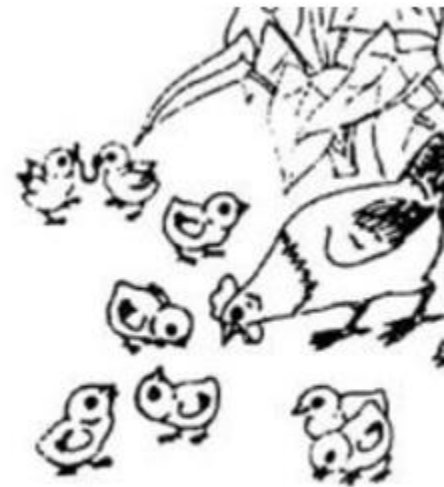
đàn gà con