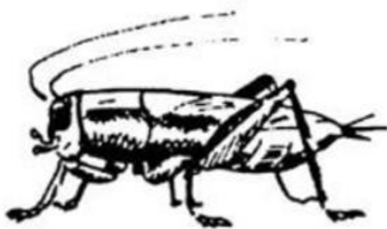
con dế mèn