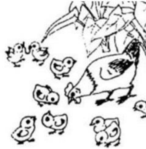
đàn gà .....