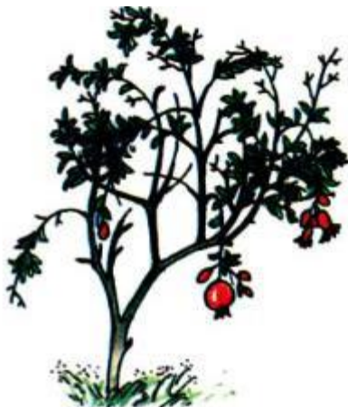
M : Cây lựu vừa bói quả.

3. Nói câu chứa tiếng có vần ưu hoặc ươu .