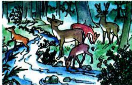
Đàn hươu uống nước suối.