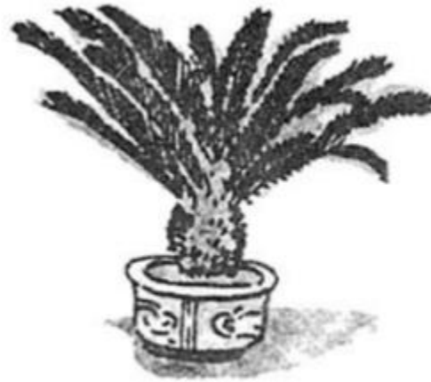
cây vạn tuế