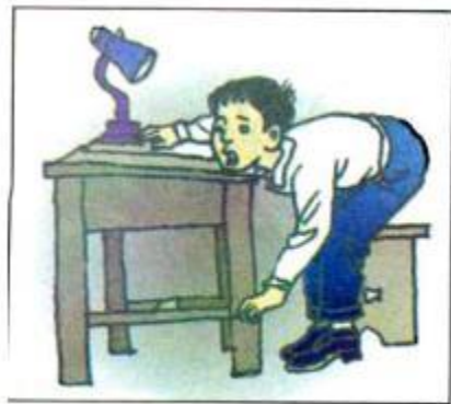
Nam ... bút.