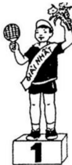
đoắ giải nhất