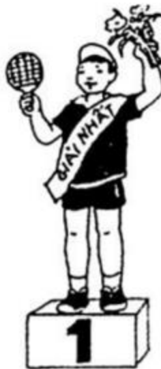
đ..... giải nhất