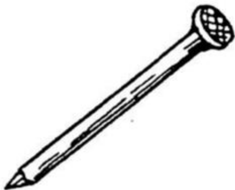
cái đinh nhọn hoắ