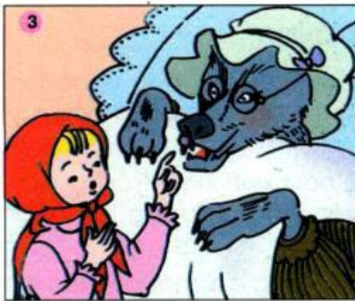
Sói đến nhà bà làm gì ? Khăn Đỏ hỏi gì ? Sói trả lời thế nào ?