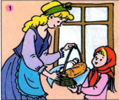
Khăn Đỏ được mẹ giao việc gì ?