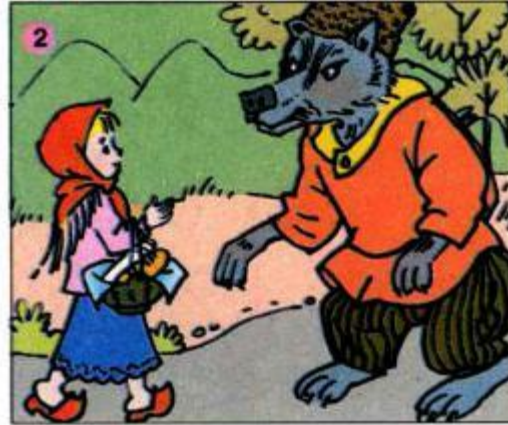
Khăn Đỏ bị Sói lừa như thế nào ?