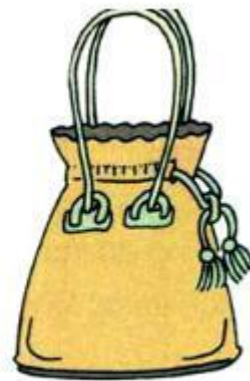
túi x'... tay