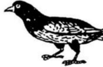
chim bìm b