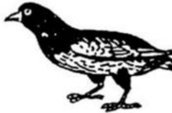
chim bìm b