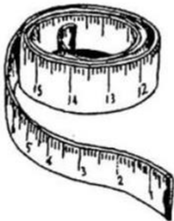
cái thước dây