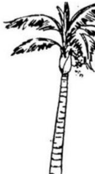
cây cao v