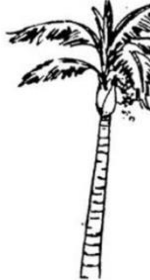
cây cao v