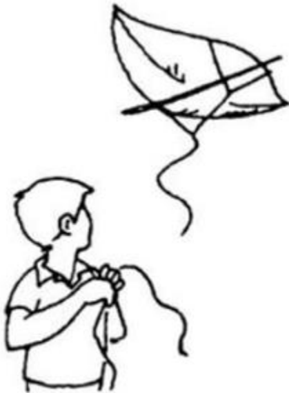
điều dứt dây