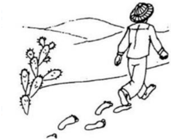
vết chân trên cát