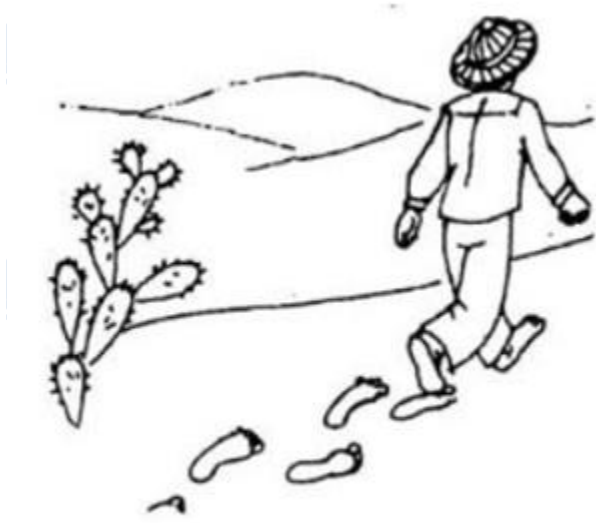
v.....chân trên cát

Hoạt động 2 trang 72 vở bài tập Tiếng Việt lớp 1: Điền et hay êt?