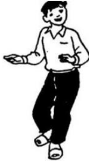
đi nhún nhảy