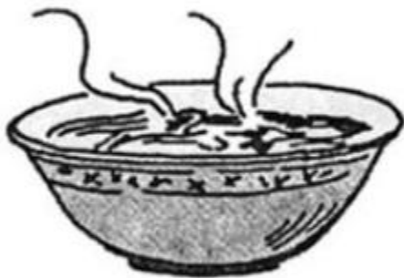
tô b... bò

Hoạt động 2 trang 49 vở bài tập Tiếng Việt lớp 1: Điền in hay un?