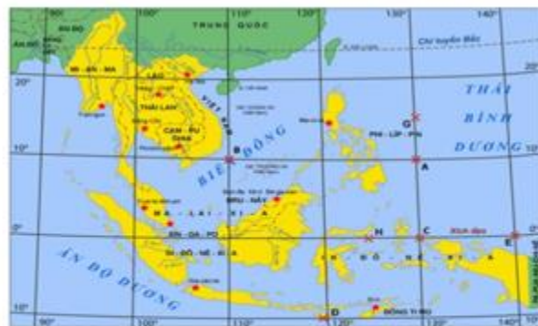
Hình 12. Bản đồ thủ đồ các nước ở khu vực Đông Nam Á

Trên bản đồ địa điểm có tọa độ địa lí: \left\{ \begin{array}{l} 130^{\circ} \text{Đ} \\ 15^{\circ} \text{B} \end{array} \right.