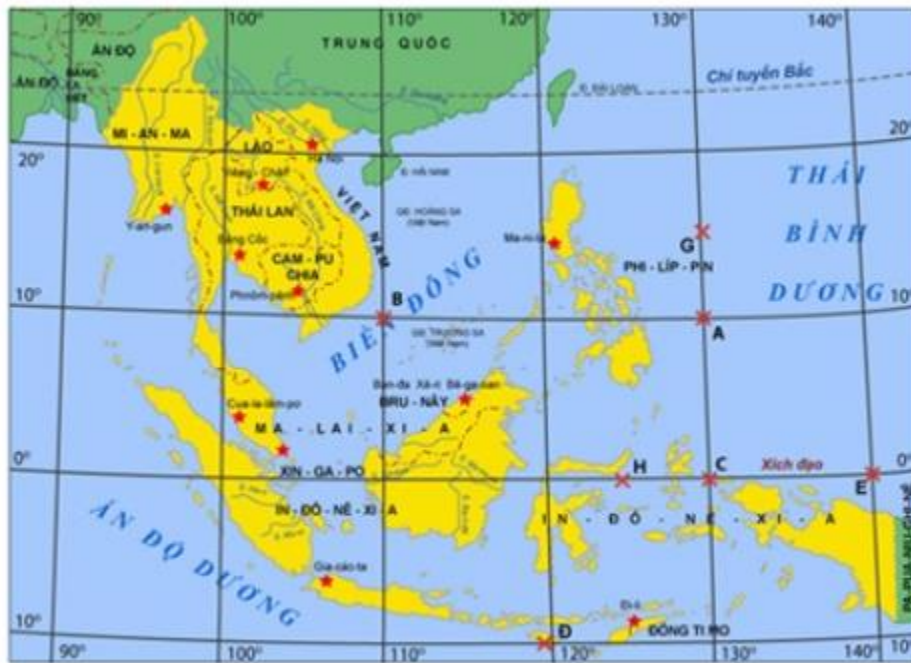
Hình 12. Bản đồ thủ đô các nước ở khu vực Đông Nam Á

Cho biết thủ đô Ban-đa Xê-ri Bê-ga-oan (Bru-nây) có tọa độ địa lí là bao nhiêu?