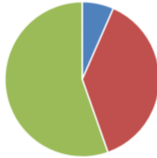
Cá biển khai thác