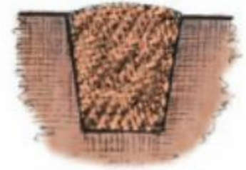
Hình 35. Bón phân lót