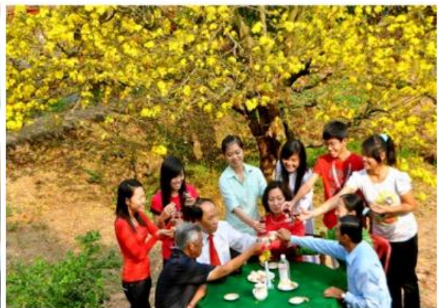
Tết ở 2 miền Bắc - Nam

Phân lãnh thổ phía Bắc (từ Phân lãnh thổ phía Nam (từ Bạch Mã