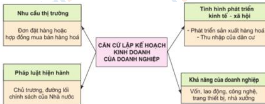
Hình 53.1. Sơ đồ về các căn cứ lập kế hoạch kinh doanh của doanh nghiệp

Lập kế hoạch kinh doanh của doanh nghiệp thường căn cứ vào 4 yếu tố cơ bản: nhu cầu thị trường, tình hình phát triển kinh tế xã hội, pháp luật hiện hành và khả năng của doanh nghiệp