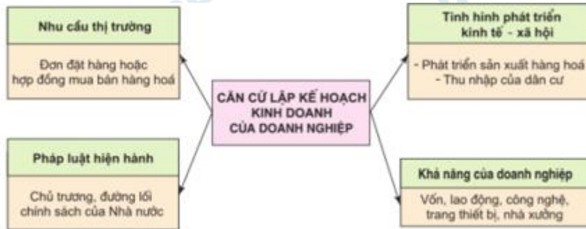
Hình 53.1. Sơ đồ về các căn cứ lập kế hoạch kinh doanh của doanh nghiệp

Lập kế hoạch kinh doanh của doanh nghiệp thường căn cứ vào 4 yếu tố cơ bản: nhu cầu thị trường, tình hình phát triển kinh tế xã hội, pháp luật hiện hành và khả năng doanh nghiệp