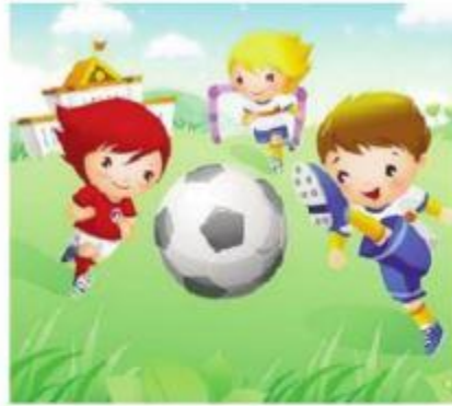
Hình 98 Cầu thủ

Thắng thắn Anh dũng Giải thưởng Bãi biển Tuổi trẻ Cầu thủ Trò chơi Sửa chữa Đẹp đẽ Đã ngoại