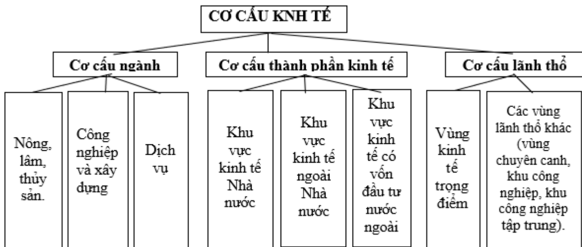
Sơ đồ Cơ cấu nền kinh tế