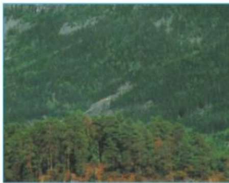
Hình 59.3 - Rừng taiga