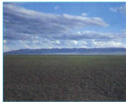
Hình 59.4 - Thảo nguyên