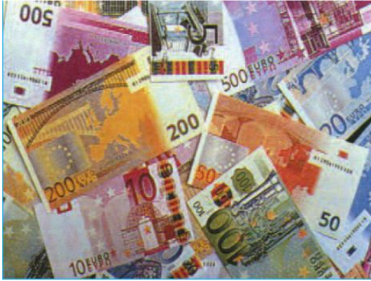
Hình 60.2 - Đồng tiền chung châu Âu