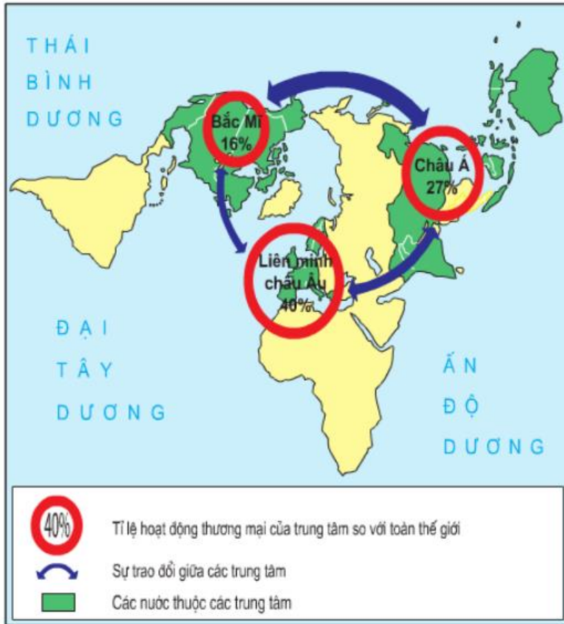
Hình 60.3 - Các trung tâm thương mại lớn trên thế giới