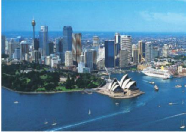
Hình 49.1 - Thành phố Xit-ni (Ô-xtrây-li-a)