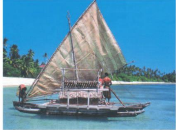
Hình 49.2 - Người Pô-li-nê-diêng chuẩn bị ra khơi