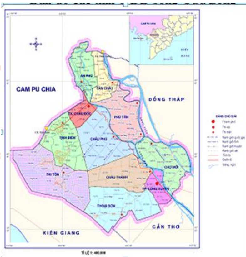
Lược đồ An Giang