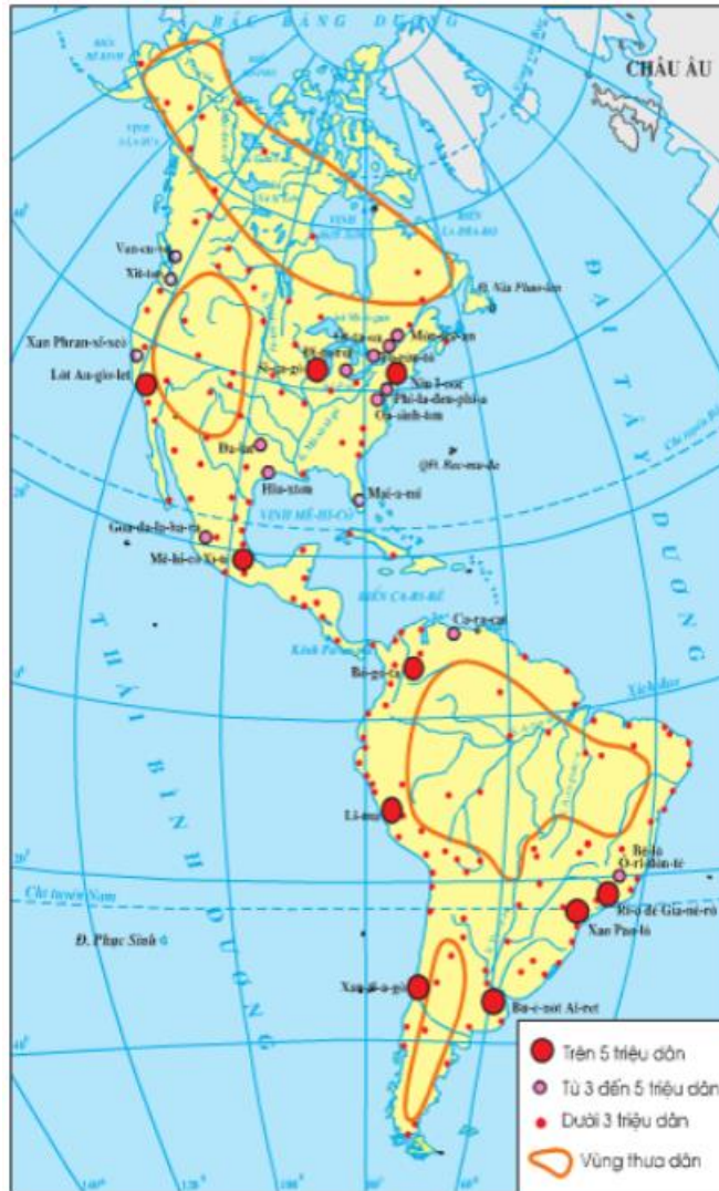
Hình 43.1 - Lược đồ các đô thị châu Mỹ

- Các đô thị lớn: Xao –Paolô, Riô-đê Gia-nê-rô, Bu-ê-nô-t-Ai-ret.