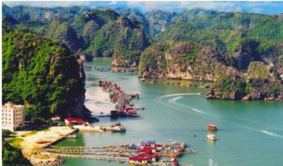
Hình 4. Đảo Cát Bà.