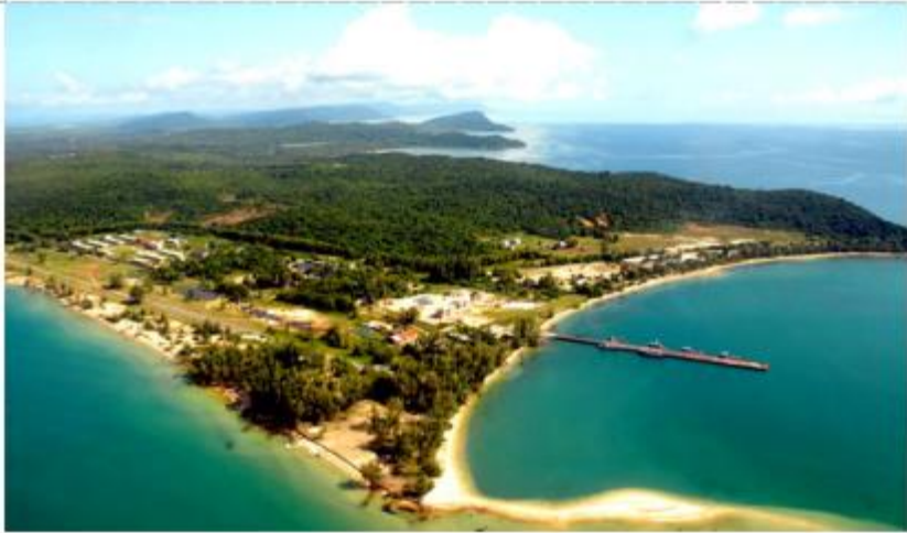
Hình 3. Đảo Phú Quốc.