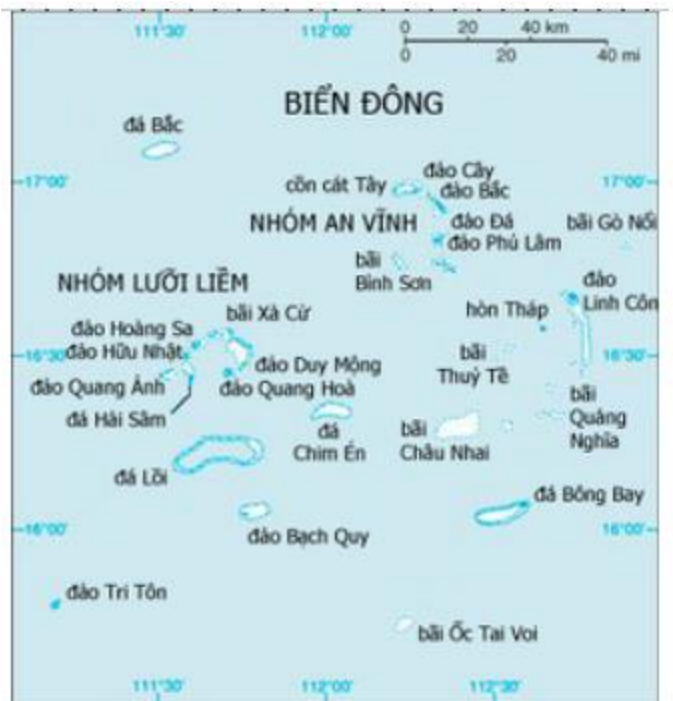
Hình 1: Các đảo thuộc đảo Hoàng Sa