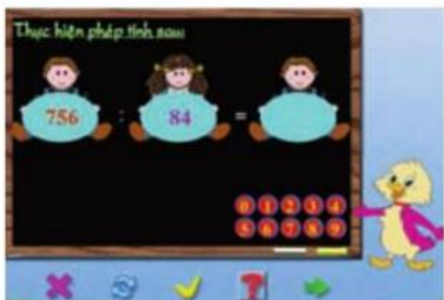
Chia hai số theo hàng ngang.