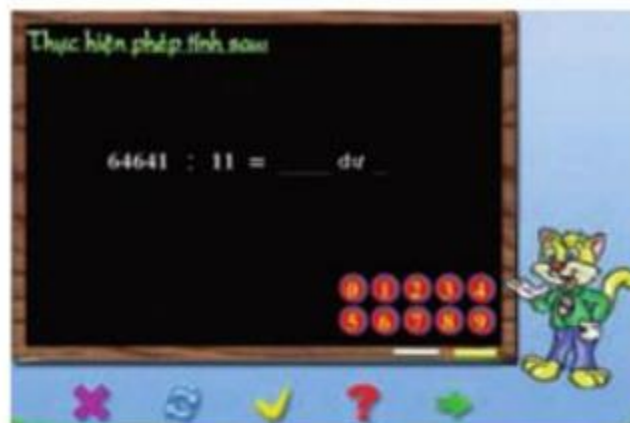
Chia hai số theo hàng ngang.