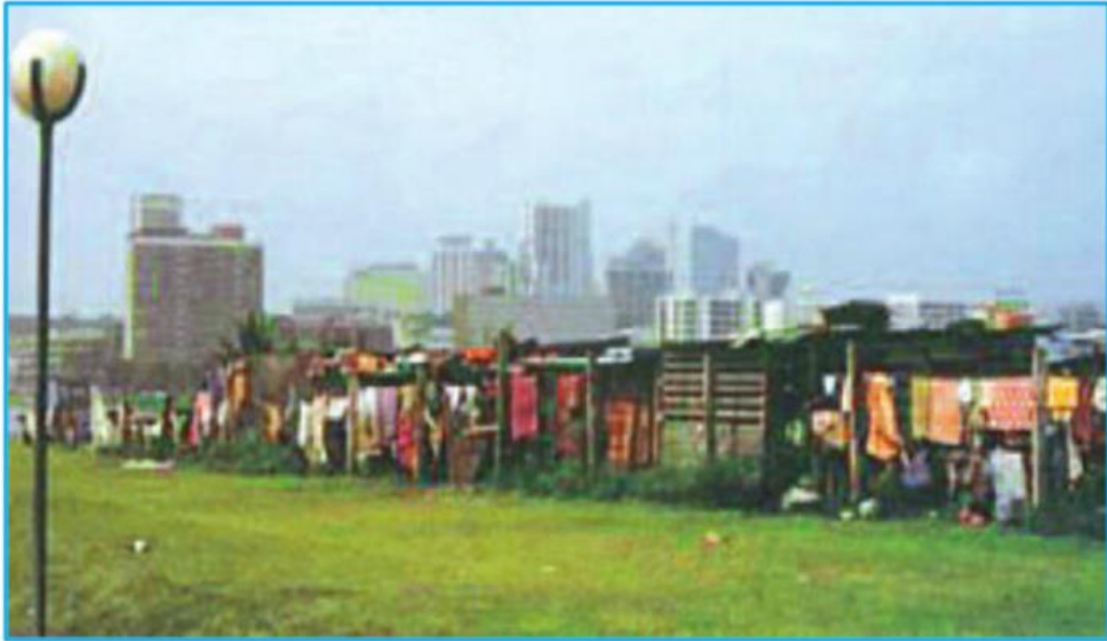
Hình 31.2 - Khu nhà ổ chuột ở A-bit-gian (Cốt Đi-voa)