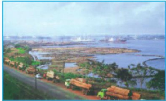
Hình 32.5 - Xuất khẩu gỗ