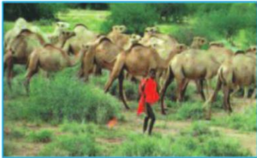
Hình 32.4 - Chăn nuôi du mục

- Các ngành kinh tế: khai thác lâm sản, khoáng sản, trồng cây công nghiệp xuất khẩu.