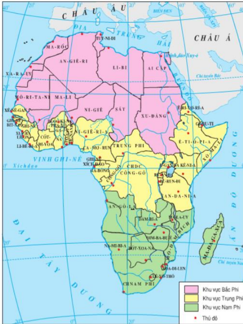
Hình 33.1. Lược đồ ba khu vực châu Phi