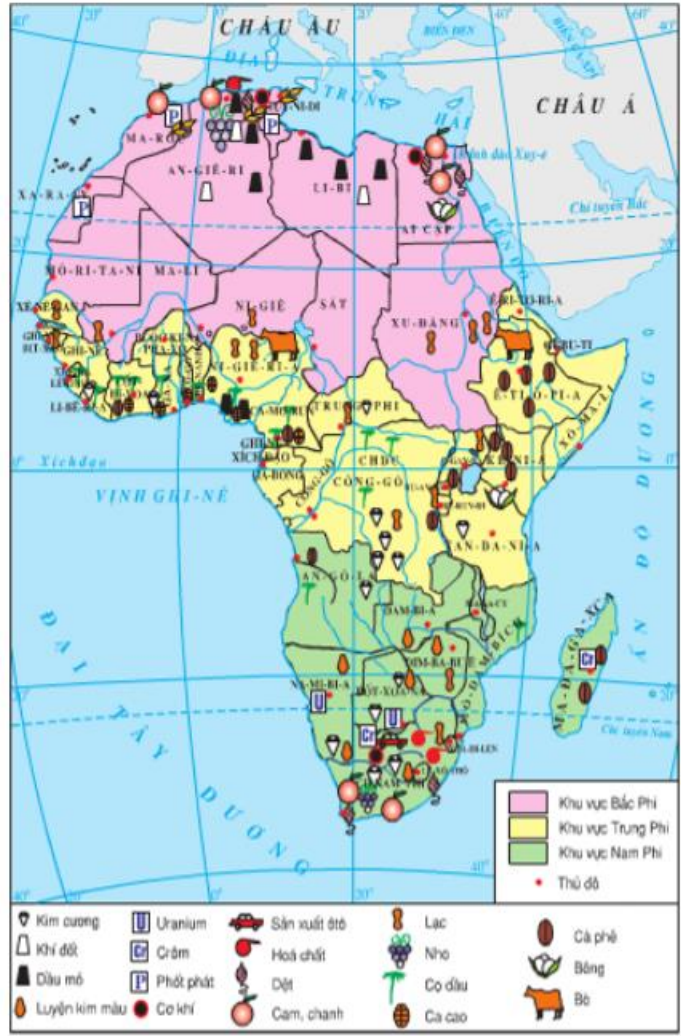
Hình 33.2. Lược đồ kinh tế châu Phi