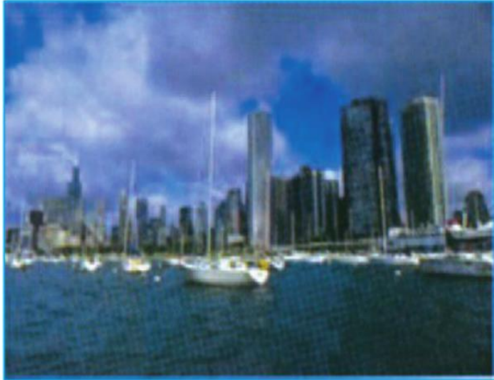
Hình 37.2 - Thành phố Si-ca-gô