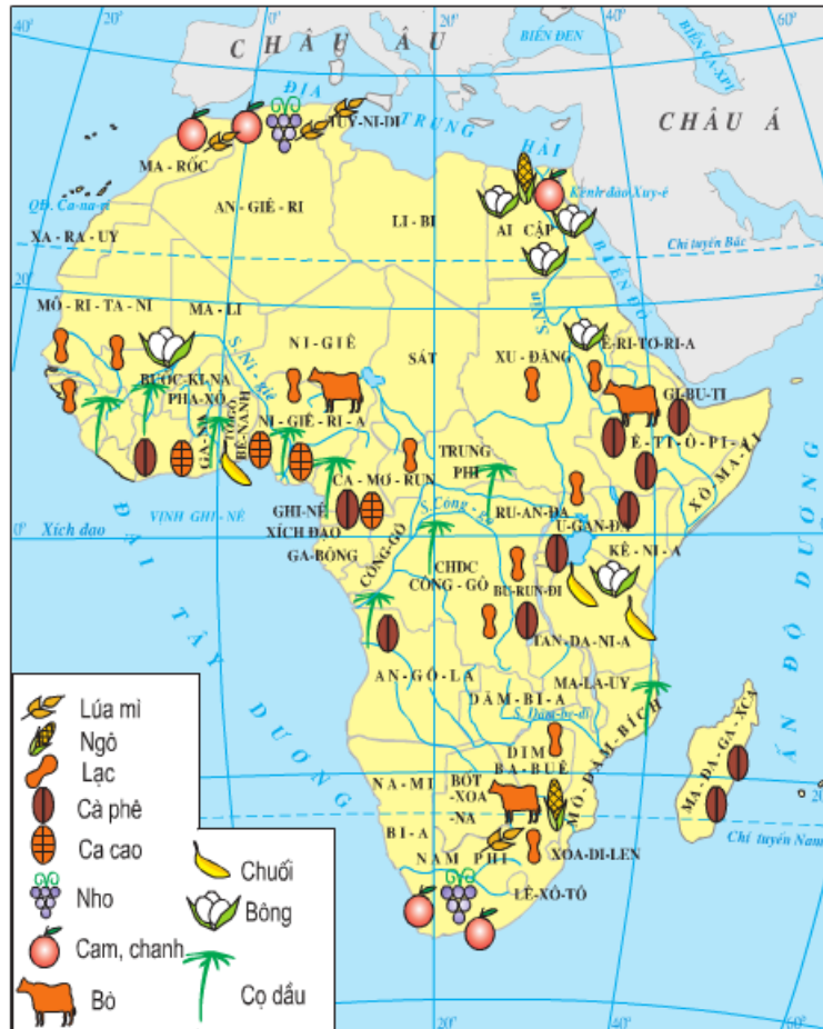
Hình 30.1 - Lược đồ nông nghiệp Châu Phi.