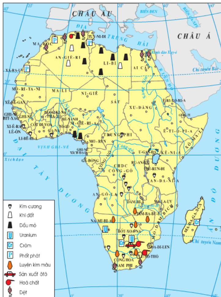
Hình 30.2 - Lược đồ công nghiệp Châu Phi.

Lý thuyết Địa Lí 7 Bài 30: Kinh tế châu Phi hay, chi tiết