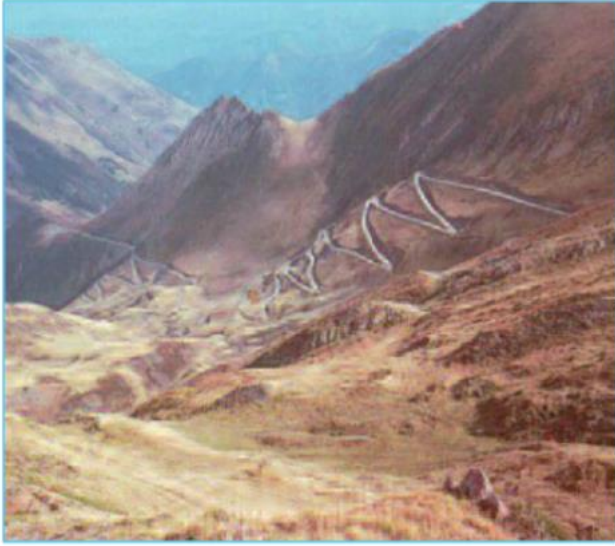
Hình 24.3 - Đường ô tô vượt qua một vùng núi hiểm trở của châu Á