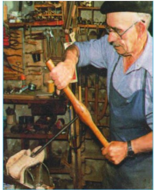
Hình 24.2 - Làm nghề thủ công trong một vùng núi ở châu Âu