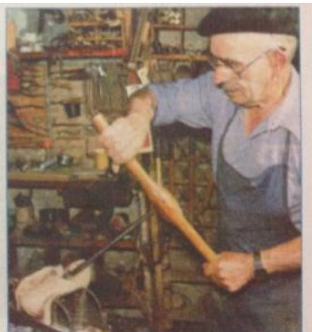
Hình 24.2 - Làm nghề thủ công trong một vùng núi ở châu Âu