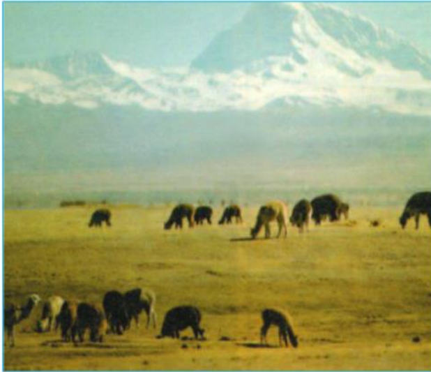
Hình 24.1 - Chăn nuôi lạc đà Lama trên một vùng núi ở Nam Mỹ