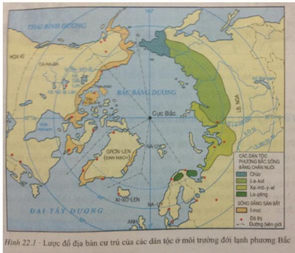
Hình 22.1 - Lược đồ địa bàn cư trú của các dân tộc ở môi trường đới lạnh phương Bắc