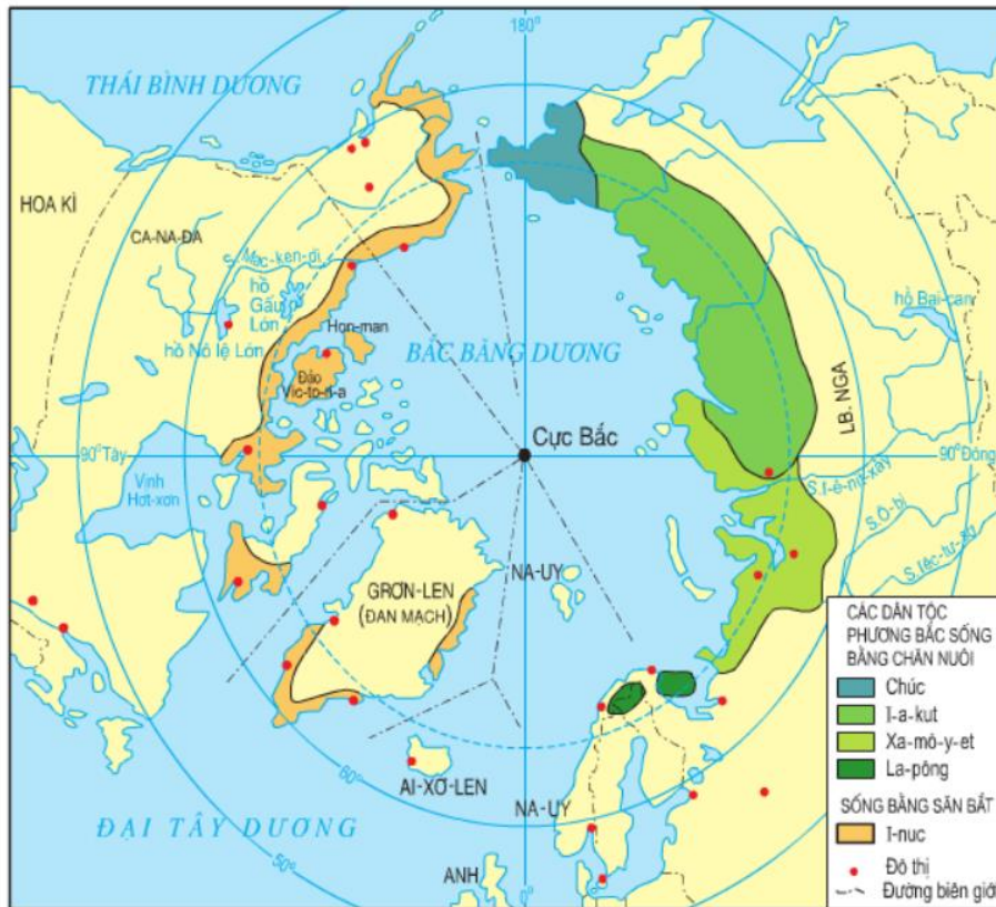
Hình 22.1 - Lược đồ địa bàn cư trú của các dân tộc ở môi trường đới lạnh phương Bắc