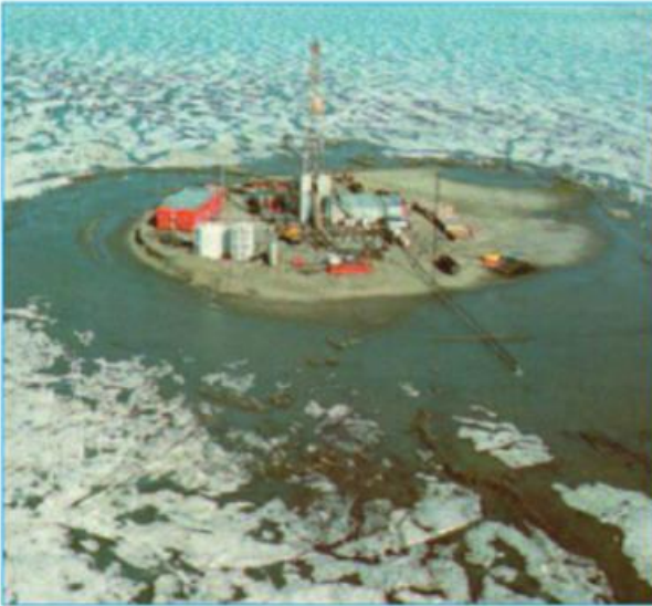
Hình 22.4 - Dàn khoan dầu mỏ trên biển băng phương Bắc