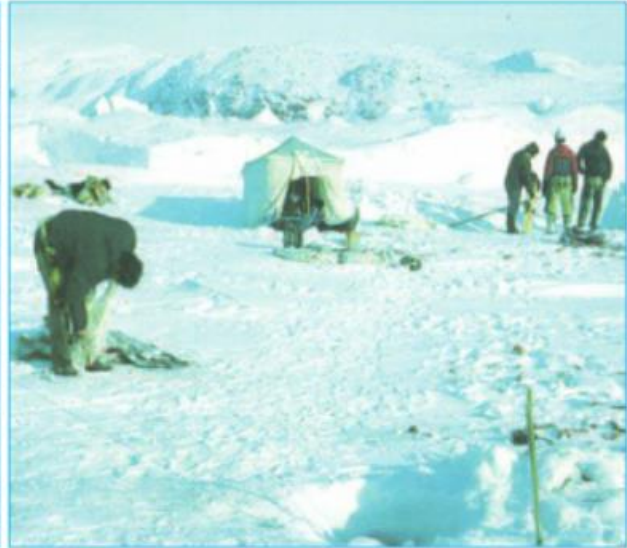
Hình 22.5 - Khoan thăm dò trên lục địa Nam Cực