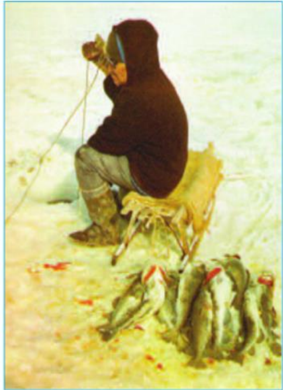
Hình 22.3 - Người I-nuc câu cá qua một hố băng